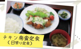
チキン南蛮定食 (日替り定食)