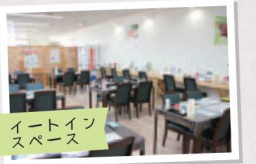
イートインスペース